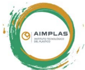
Tehnološki institut za plastiku